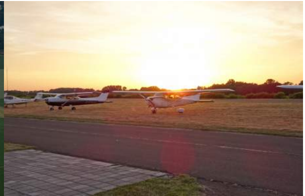
Abendstimmung in Ganderkesee

Am Abend gab es wieder tolles Buffet im Flugplatzrestaurant und danach noch gemütliches Zusammensitzen in der Hotelbar bis nach Mitternacht.