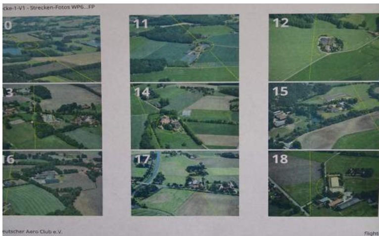
Fotos ... die man finden sollte...