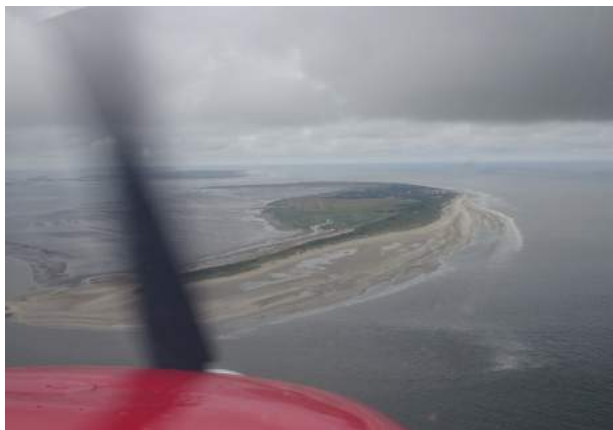
Anflug auf Wangerooge ...