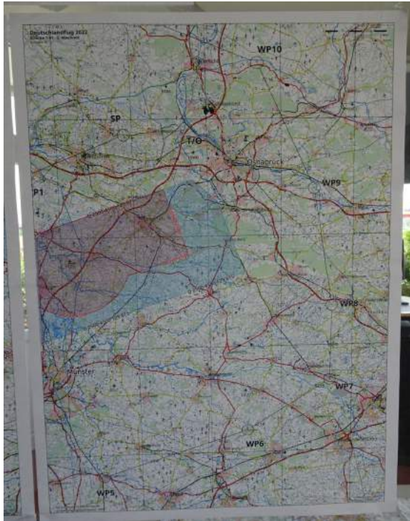
Wettbewerbsgebiet Teilstrecke Tag1