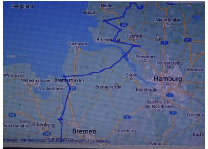
Route Tag 3